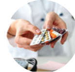
Medicamentos Médicos y enfermeras. Sistema Emergencia (9-1-1).