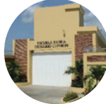
Escuelas Tanda extendida y Libros de texto.